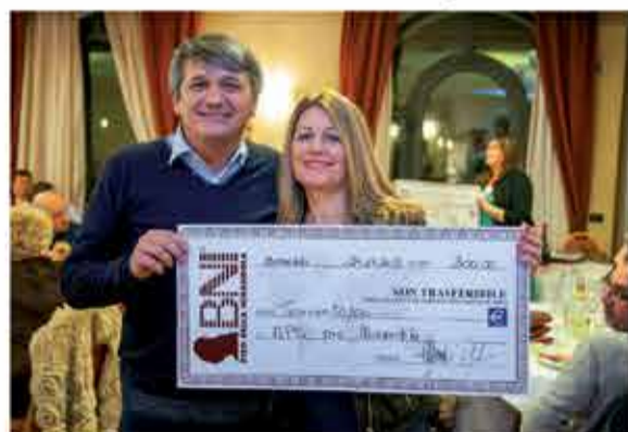
Medolla, 29.03.2019 a La Cantina Devoluzione ad Assoc. Pro Mirandola