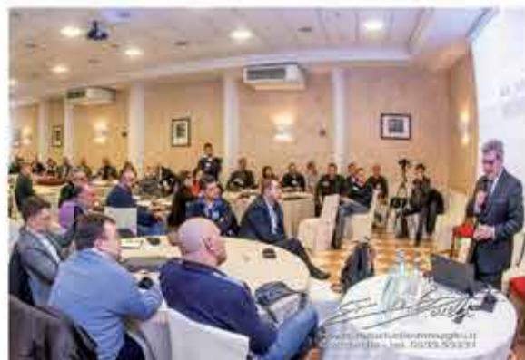
Mirandola, Sede di Villa Tagliata Ore 7,00: una riunione di Capitolo il venerdì...