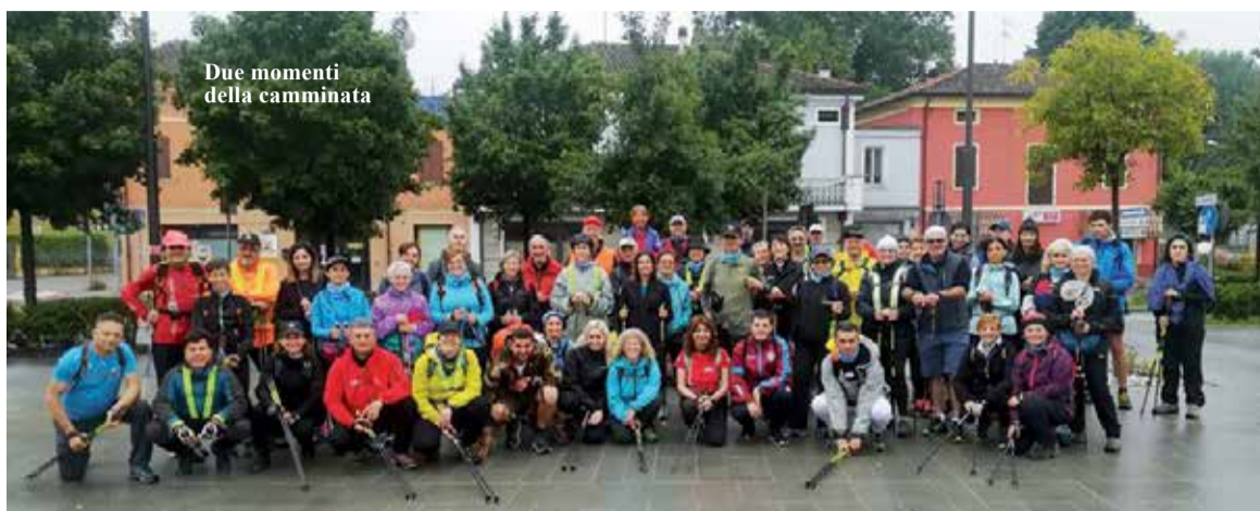
Due momenti della camminata