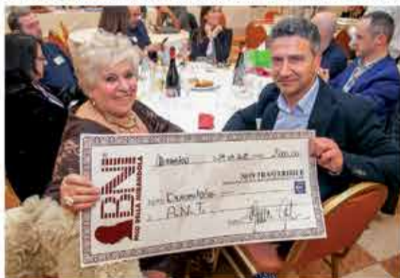
Medolla, 29.03.2019 a La Cantina Devoluzione ad A.N.T. Mirandola