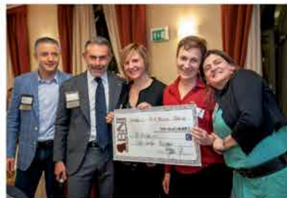
Medolla, 29.03.2019 a La Cantina Devoluzione ad Assoc. Genitori Mirandola