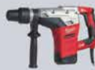
MARTELLO DEMOLITORE composto di punta

1° GIORNO € 90 WEEK-END € 160 SETTIMANA € 500