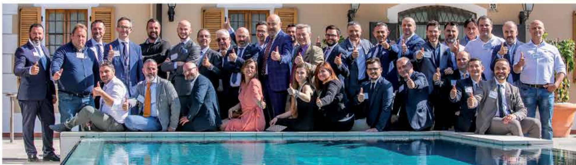
Mirandola, 01.06.2018 Sede in Villa Tagliata Lancio del Capitolo BNI Pico della Mirandola con 32 Membri BNI