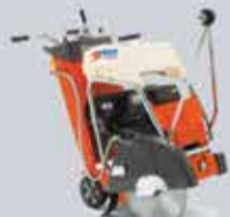
TAGLIA SUOLO usura 65 €/mm (1 mm incluso)

1° GIORNO € 40 WEEK-END € 70 SETTIMANA € 250