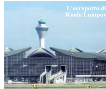
L'aeroporto di Kuala Lumpur