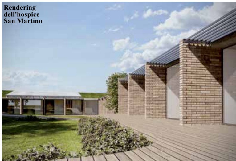
Rendering dell'hospice San Martino

nucleo familiare è assente o non in grado di prendersi cura del proprio caro a domicilio; in questi casi si parla di ricovero finalizzato anche al temporaneo sollievo della famiglia per un periodo limitato e con la prospettiva del rientro nella propria casa. L'assistenza in hospice rappresenta la massima espressione dei concetti di sostegno globale alla persona malata e di accompagnamento nelle fasi critiche della malattia e nel fine-vita. L'accesso all'hospice è completamente gratuito. La struttura è in un ambito rurale, ben connesso con i centri abitati, equidistante da Carpi e Mirandola, ma immerso nella natura, tra i pioppeti del bordo Secchia e i campi coltivati della pianura, ampio, luminoso e silenzioso. L'area ha una superficie di 15.967 metri quadrati, di cui 6.000 metri quadrati saranno destinati alla realizzazione di un grande giardino. L'hospice San Martino risponde alle esigenze di una popolazione di circa 190.000 abitanti mettendo a disposizione 14 posti letto; l'edificio svilupperà una superficie iniziale di 1.800, fino a un massimo di 2.500 metri quadrati, per le funzioni di residenza e di supporto clinico, con spazi meeting e sale per le associazioni. Il tutto è completato da parcheggi, giardini e attrezzature pubbliche.