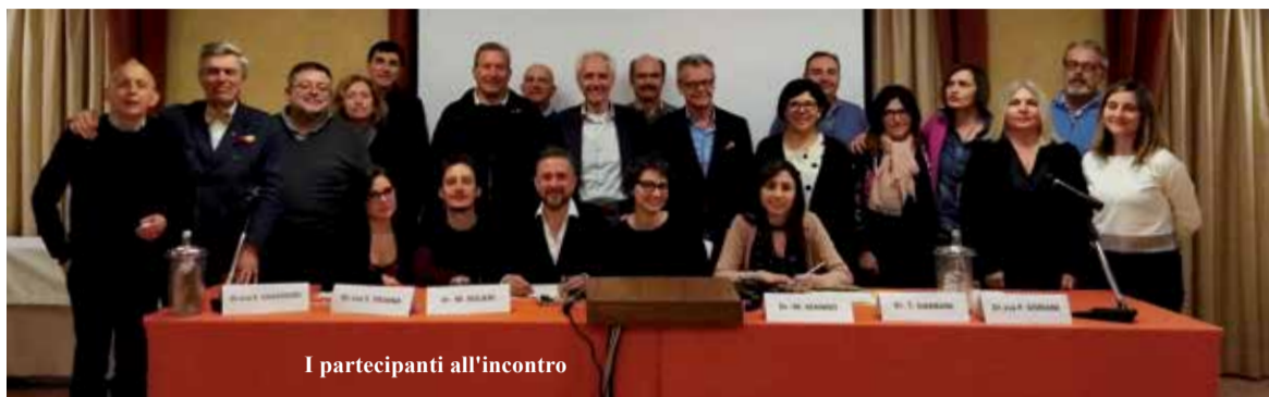
I partecipanti all'incontro

Un convegno di gastroenterologia ha fatto il punto sul rapporto col paziente