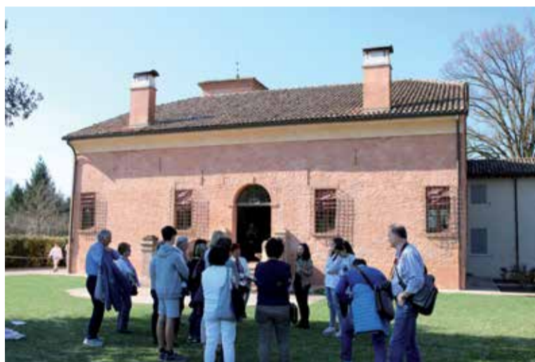
Alcuni momenti della 27esima edizione delle Giornate Fai di Primavera nella Bassa