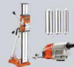
CAROTATRICE usura 55 €/mm (1 mm incluso)

1° GIORNO € 60 WEEK-END € 100 SETTIMANA € 300