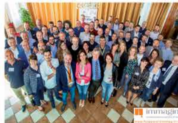
Mirandola, 31.05.2019 Sede di Villa Tagliata, i 77 membri del Capitolo Pico della Mirandola.