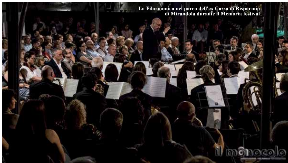
La Filarmonica nel parco dell'ex Cassa di Risparmio di Mirandola durante il Memoria festival

da Stefano Gatta tra alcuni dei brani più significativi a livello compositivo di musica originale per banda e brani