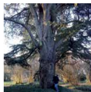
Due dei tre giganti della Bassa che potranno essere ammirati domenica 23 giugno