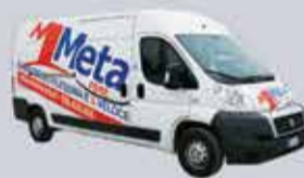
FIAT DUCATO 130 km/gg

1° GIORNO € 48 WEEK-END € 40 SETTIMANA € 150