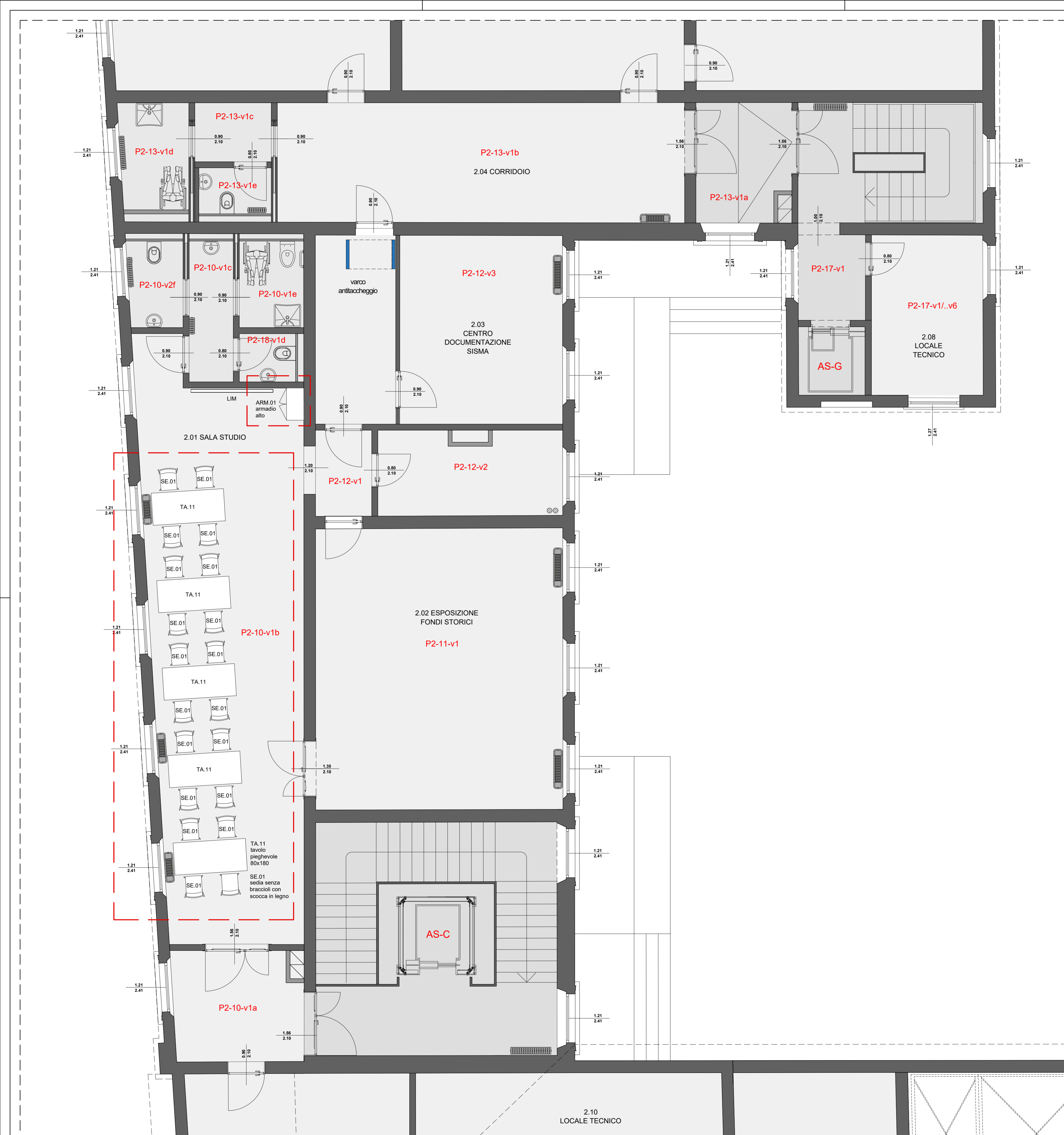
PIANTA ARREDATA PIANO SECONDO | ESTRATTO "G" scala 1:50