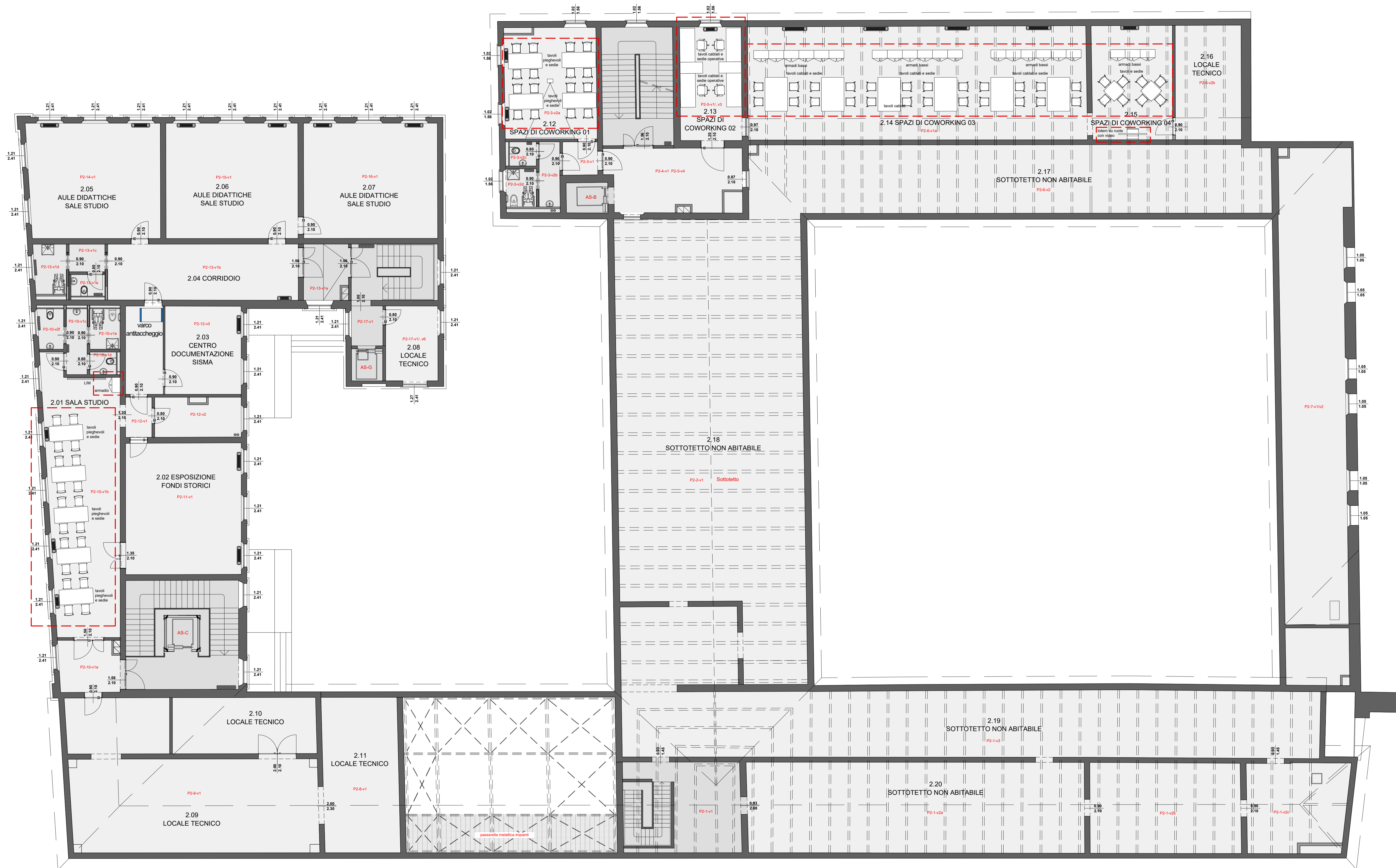
PIANTA ARREDATA PIANO SECONDO scala 1:100