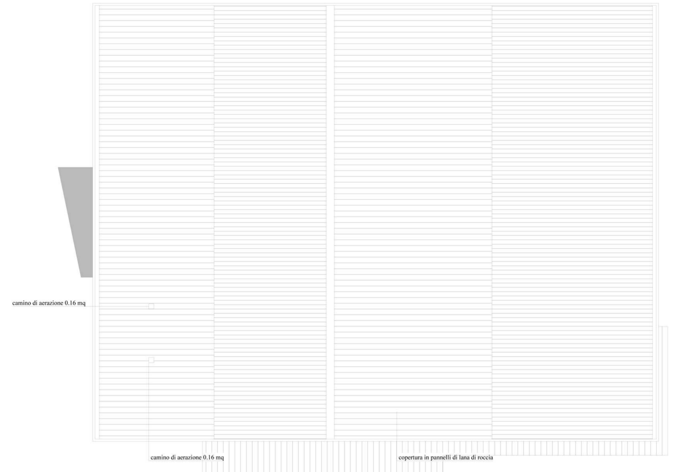
PIANO COPERTURA - scala 1:200